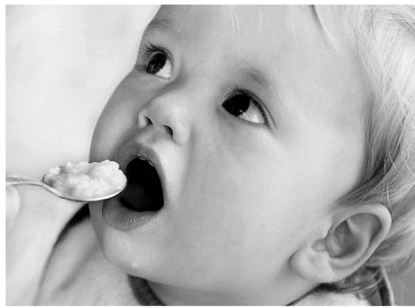
Совсем не детский вопрос: «Какое масло в каше?»

чили невысокую оценку, в том числе производства ЗАО «Молокозавод» поселка Кшень Курской области; ИП Горшкова из села Павелец Рязанской обл.; ЗАО «Алексеевский молочноконсервный комбинат» Белгородской области; ОАО «Тулчинка» из села Засосна Белгородской области; ОАО «Маслодельный завод Новохоперский», ОАО «Каменкамолочко», ОАО «ВИММ-БИЛЛЬ-ДАНН» п.г.т. Анна, ОАО «Землянкамолочко» Воронежской области; ОАО «Юнимилк» из Липецка; деревни Долгое Ледово Щелковского района Московской области. В отдельных образцах эксперты отмечали слабую горечь, прогорклость, посторонний вкус и запах, слабый аромат, легковлажность. Помимо органолептической экспертизы, для определения физико-химических показателей все образцы были сданы в лабораторию ФГУЗ «Центр гигиены и эпидемиологии в Воронежской области». И вот каковы заключения: масло, отобранное в больнице № 3 Воронежца, производства села Павелец Рязанской области – не соответствует по жирно-кислотному составу, что свидетельствует о фальсификации жирами немолочного происхождения. Масло из областной детской клинической больницы № 2 производства ОАО «Маслодельный