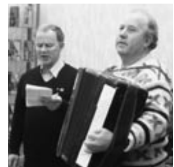
Десантники и пели.

Здесь была и подборка публикаций местных газет о том, каким должен быть памятник ВДВ в Воронеже.