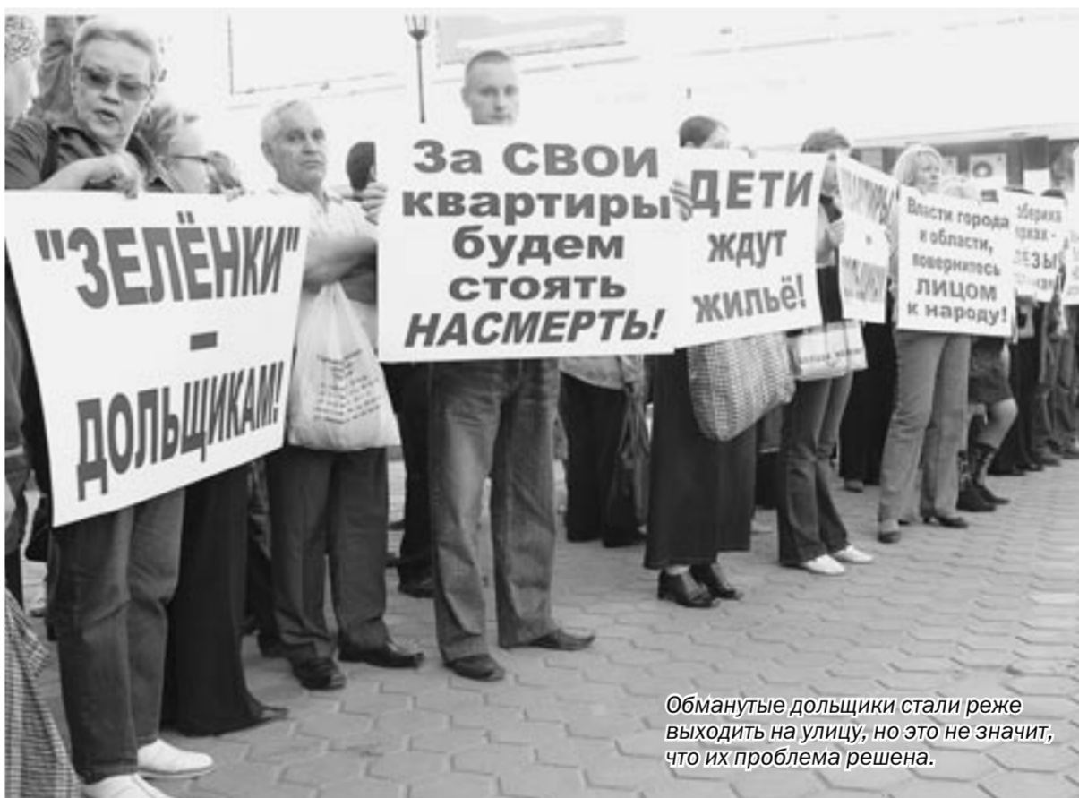
Обманутые дольщики стали реже выходить на улицу, но это не значит, что их проблема решена.

С горечью констатируем: обман дольщиков в Воронеже стал нормой. А у этой нормы один закон: если у кого-то денег убыло, то они непременно появились в других карманах.