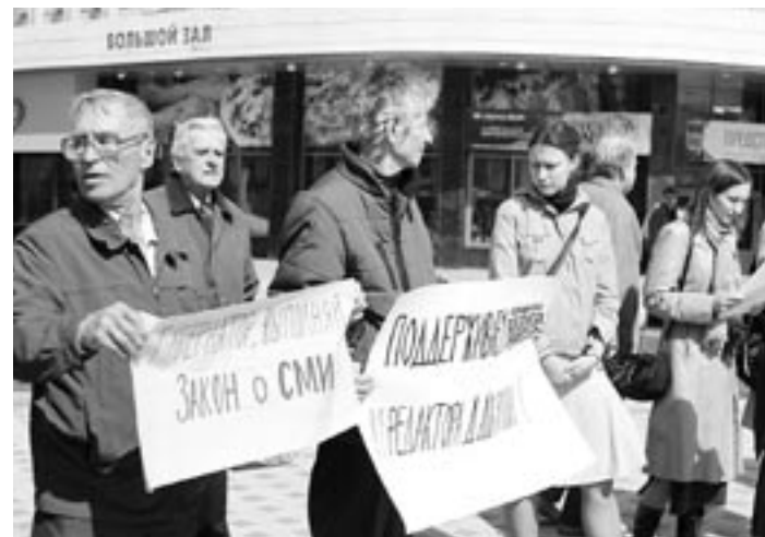
Вчера у театра «Пролетарий» прошёл пикет в защиту газеты «Воронежский курьер».

Журналисты «Воронежского курьера», где учредитель недавно сменил главного редактора без учёта их мнения, хотят лично узнать от губернатора, что он думает «о судьбе свободы слова в Воронежской области».