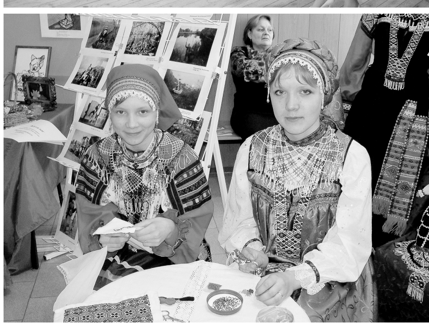
Красоту девочки создают из бисера.

район заселён выходцами из Украины – хохлами, проще говоря. Но есть один хутор – Гальский, где жили с русскими корнями. Естественно, что в их costume – понёва и кичка, а в украинском – спидница, а на голове веночек из цветов. В прошлом каждое здешнее село гордилось своими нарядами и бережно хранило их. У каждого был свой орнамент в вышивке и ткачестве, а потому подгоренские школяры записали у старожилов особенности костюма и постарались его воссоздать в коллекции кукол.