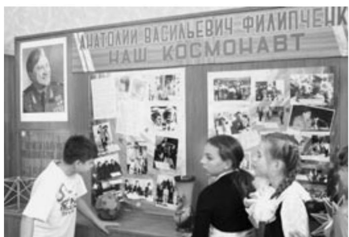
Экспозиция, посвященная лётчику-космонавту А.В.Филиппенко.

Копилка педагогического опыта учителей школы № 2 по воспитанию гражданских, патриотических чувств у ребят постоянно пополняется. Тому способствуют давние традиции и имена тех, кто учился в этих стенах. Один из них – космонавт, дважды Герой Советского Союза Анатолий Филиппенко.