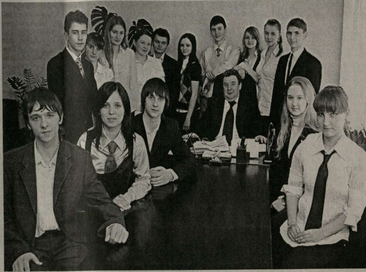
Счастливые ученики со счастливым директором.