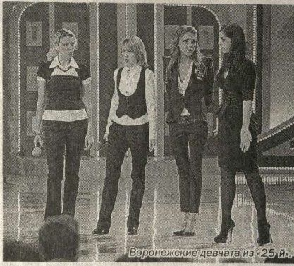
Воронежские девочки из «25-й».