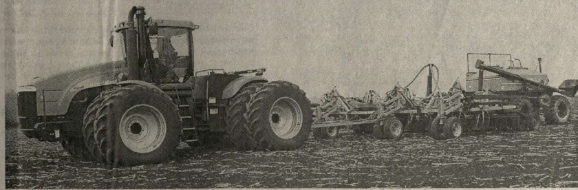
Лучшая память о тех, кто не вернулся с войны – это высокие урожаи на той земле, которую они защищали. Причём высокие урожаи из года в год, независимо от капризов природы. Так считают в ЗАО «Агротек-Подгоренская». Здесь, благодаря последовательной и целеустремлённой политике генераль-

– С животноводством есть пока определённые трудности. Сейчас мы прорабатываем вопрос касательно строительства на территории района современных животноводческих комплексов. Ведём переговоры с немецкими, которые возводят на территории Белгородской области свиноводческие комплексы (каждый рассчитан на производство шести с половиной тысяч тонн мяса свинины в год). Здесь очень важно не упустить вопрос, связанный с кормовой базой. У нас появилась идея построить эле-