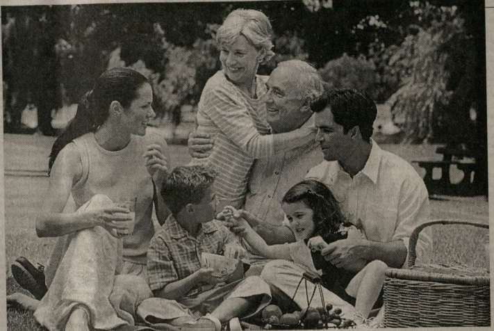
Наш организм борется за сохранение своего здоровья, поддерживая в «боевой готовности» собственные различные охраняющие системы. Наша задача не мешать ему в этом.

Наконец, собственно иммунная система. Это самая изощренная защитная система, работающая на очень тонких уровнях: ее агентами являются клетки и антитела в крови. Иммунная система отражает биологические атаки на организм. Ее цели — это бактерии, микробы, вирусы, лобные чужеродные белки. Иммунная система работает в теснейшем контакте с эндокринной. Разница между ними довольно очевидна. Если иммунная система борется с внешними опасностями биологического происхождения, то эндокринная поддерживает в рабочем состоянии внутренние органы человека. Когда что-то начинает давать сбои, эндокринная система врыскивает в кровь гормоны, восстанавливающие необходимое равновесие или функцию отдельных органов. По-настоящему одной из частей эндокринной системы является щитовидная железа, ее заболевание говорит о том, что сама эндокринная система нуждается в защите или «ремонте». В систему эндокринной регуляции организма входят также паращитовидные железы, вилочковая и поджелудочные железы, надпочечники, половые железы, гипофиз. Последний — крохот-