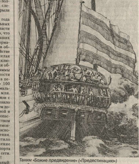
Таким «Божие предвидение» («Предестинация») изобразил голландский гравер Шхонебек.

Спуск же на воду «Божия предвидения» («Предестинация») произошёл весной 1700 года. Обстановка вокруг этого события была напряжённо-торжественная. В Воронеже по такому случаю прибыли царевна Наталья Алексеевна,