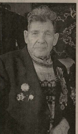
Редкостную награду ему вручил маршал Рокоссовский

Той же коветной дорожкой послал связного в роту. Ротный доложил командиру батальона, что взвод под стенами укрепления. Тот не поверил, засомневался. Меня хотел вызвать.