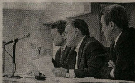
На совещании в Панино.