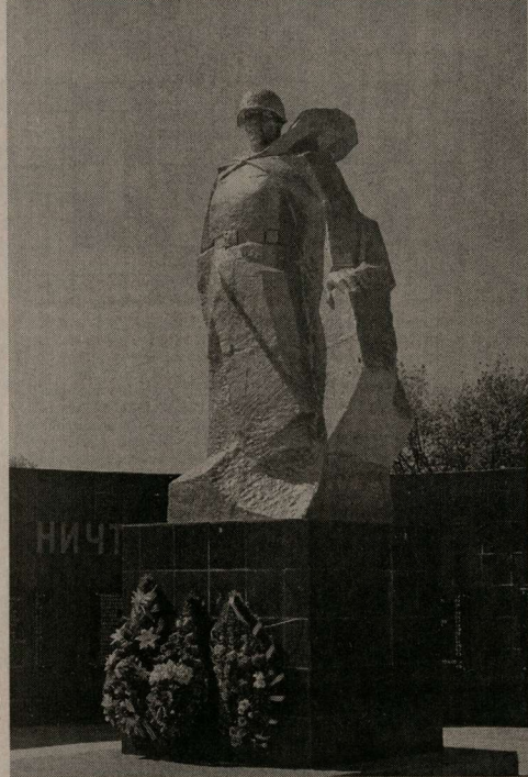
Памятник в Колодезном.