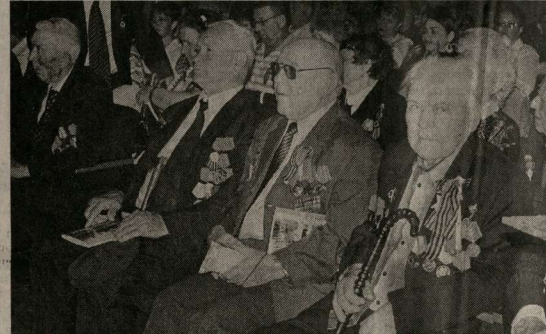
Они защищали Родину.