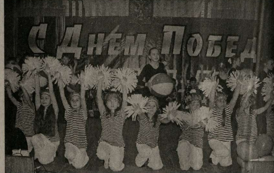
Песни и танцы в честь Победы.