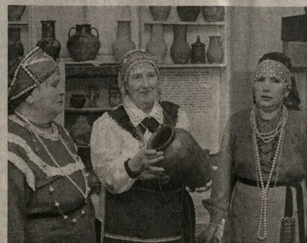
Сolistки ансамбля «Посиделки».