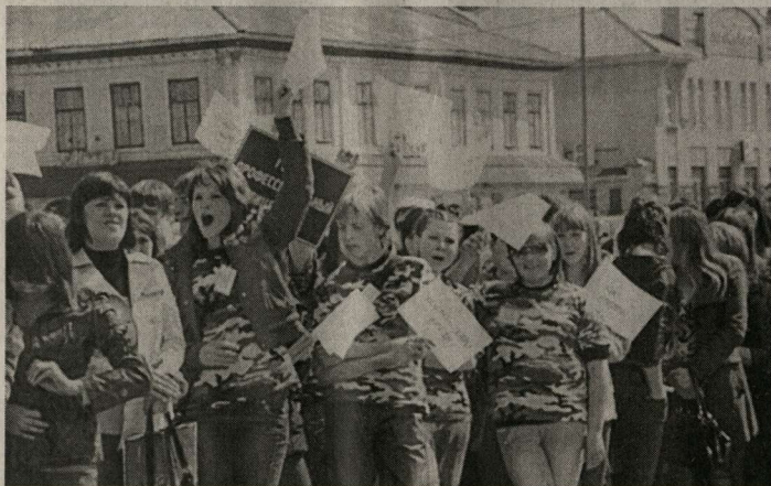
На открытии акции «Наше общее дело».