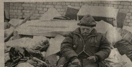
Воронежский бомж о ночлежке и не мечтает.

Еще поставили посреди комнаты двухакстентик и врубили музыку на полную. Однако тут