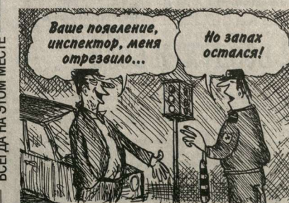
На эту тему - рядом