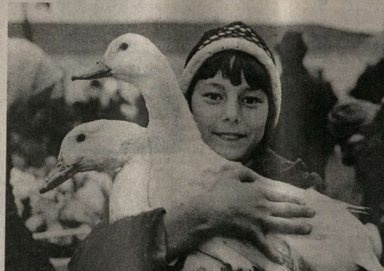
«В базарный день»