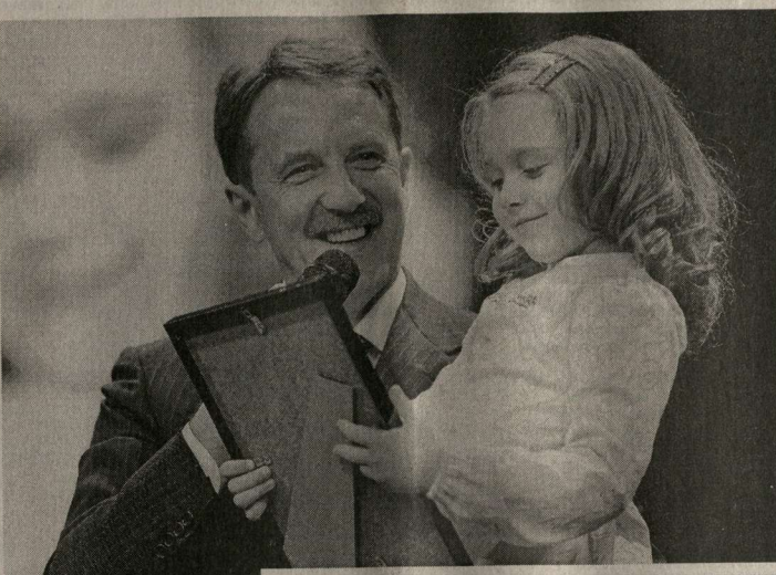
Михаил Боярский приветствует воронежских ребятишек.