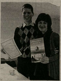
Приз победителям - учёба в Москве.