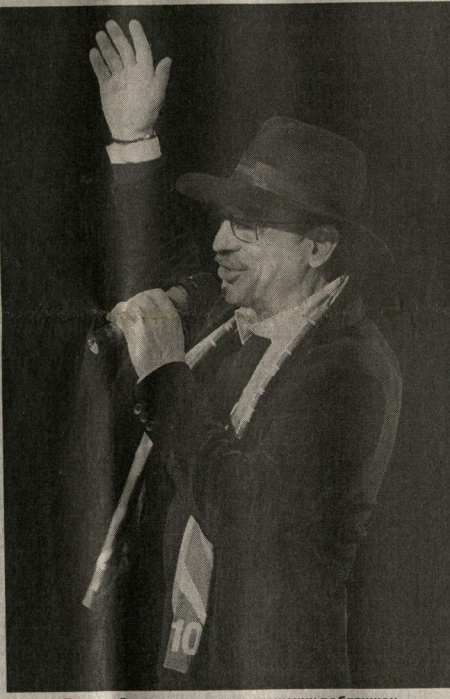
Михаил Боярский приветствует воронежских ребятишек.

Словом, «сказочный» фестиваль явно к лицу нашему городу.