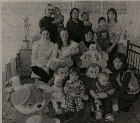
В центре репродукции семьи и детей.

«Для меня главное – ничего не упустить», – эта фраза по сути ключевая для главного врача. Реконструкция реконструируется, а лечение больных прежде всего. Коллектив немаленький – 411 медицинских работни-