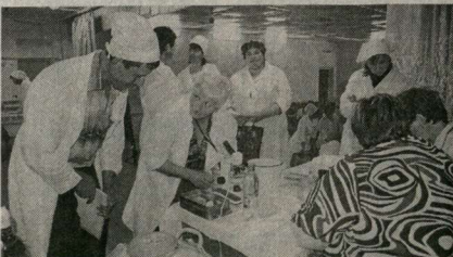
Один из моментов конкурса.