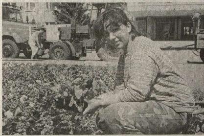
Идёт посадка летних цветов.

Общая площадь цветников в Россоши составляет более восьми тысяч квадратных метров. Всего высажено свыше одного миллиона цветов.