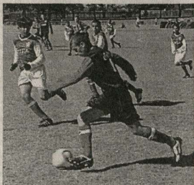
На африканском поле.

Юные футболисты богучарского клуба «Темп» заняли второе место на проходящем в ЮАР чемпионате мира среди непрофессиональных футбольных клубов. Результат, бесспорно, достойный, особенно если учитывать высочайший уровень команд-соперников из Турции, Мексики, Египта, где традиции дворового футбола очень сильны. Впрочем, с самого начала турнир для наших ребят складывался неудачно. Первый же соперник – команда Турции, бывшая явным фаворитом группы, вничью переиграла богучарцев. Счет 8:1 говорил сам за себя. Роковую роль сыграло и то, что судьи не допустили до игры пятерых футболистов основного состава, которые оказались на несколько месяцев старше требуемого возраста. Поражение было обидным, но на фоне остальных матчей не таким уж разгромным. К примеру, египтяне проиграли вьетнамцам со счетом 0:9, а сборная Мексики переиграла гватемальцев 1:0.