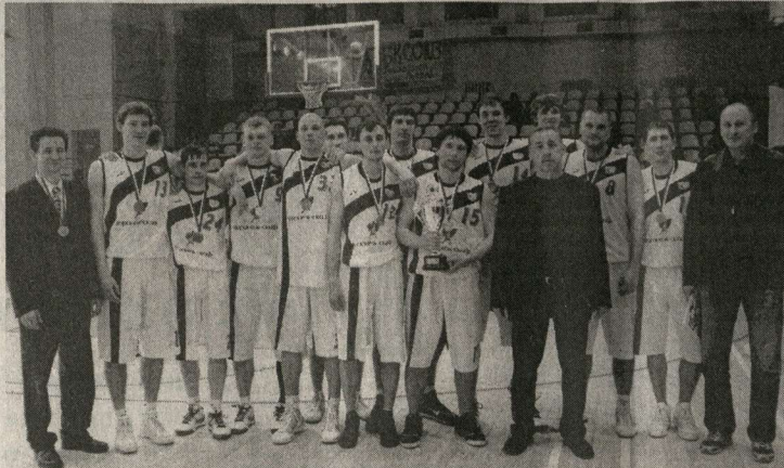
Юношеская команда «Согдiana-СКИФ» – бронзовый призёр первенства России.

Безусловно, спорт. Мне бывает очень обидно, что такой крупный мегаполис остаётся в стороне от серьёзных баскетбольных стартов. В идеале наш город должен иметь хотя бы один современный спортивный комплекс. Он бы достаточно быстро окупился! Но, увы, Воронеж пока не входит в число городов, где