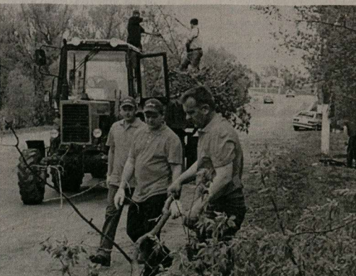
Субботник в Хохле: сотрудники «Сингенты» рассчитывают подъезды к братской могиле.