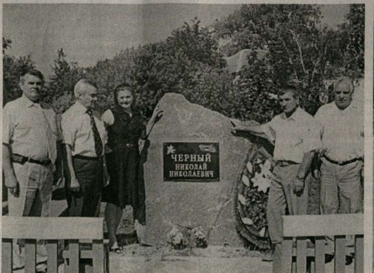
Участники проекта рядом с памятником погибшему лётчику в селе Ростоши.