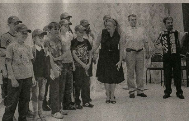
Юное поколение села Ростоши: нам мир завещано беречь!

Данные статистики говорят, что по итогам посевной кампании нынешнего сезона в хозяйствах Центрального Черноземья предпочтение отдаётся техническим культурам, где подсолнечник - в числе приоритетных. Так, например, площади под эту культуру существенно возросли, поскольку спрос на маслосемя в России стабилен. Замет-