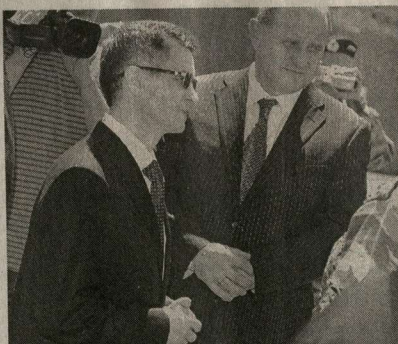
Рашид Нургалиев и Анатолий Могилёв.

Справляться со многими криминальными группировками в одиночку гораздо сложнее, - считает министр внутренних дел Украины Анатолий Могилёв. - Разобоченность наших родственных наций идёт на руку только криминалу. Современная преступность уже давно вышла за территорию межгосударственных границ. Единая система в борьбе с преступностью открывает новые возможности с международными партнерами. А их у нас немало: контрабанды, незаконный оборот оружия, беопри-