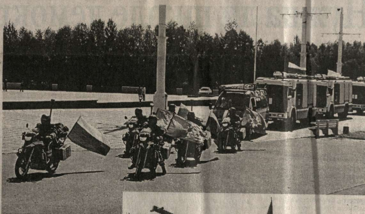
Колонна новой техники на марше.

С места события | Воронеж посмотрел современную пожарно-спасательную технику