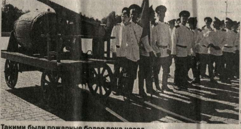
Такими были пожарные более века назад.

Колонне старт был дан 28 июня из Подольска, и приурочен к 20-летию создания федеральной