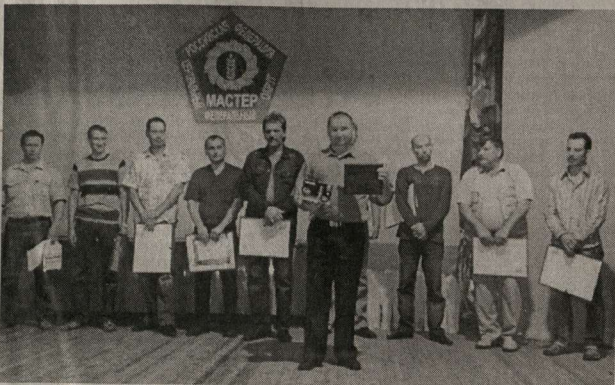
Сотрудники ОАО «Воронежгаз» регулярно радуют компанию своими успехами.

Четыре бригады «Аннрайгаз» работают на территории Аннинского, Эртильского и Паннинского районов. За шесть месяцев текущего года силами предприятия сделано 130 «внутринок» (из них в Паннинском - 93, в Аннинском - 37), сделано 260 вводов (из них в Паннинском - 160, в Аннинском - 100).