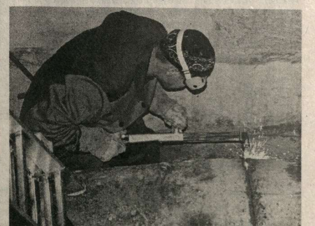
Ремонтно-профилактические работы прошли за тридцать два часа.

Словом, модернизация воронежского водопровода, отметившего в прошлом году свое 140-летие, уже началась, и если заданные темпы сохранятся, качество водоснабжения горожан будет неизменно расти.