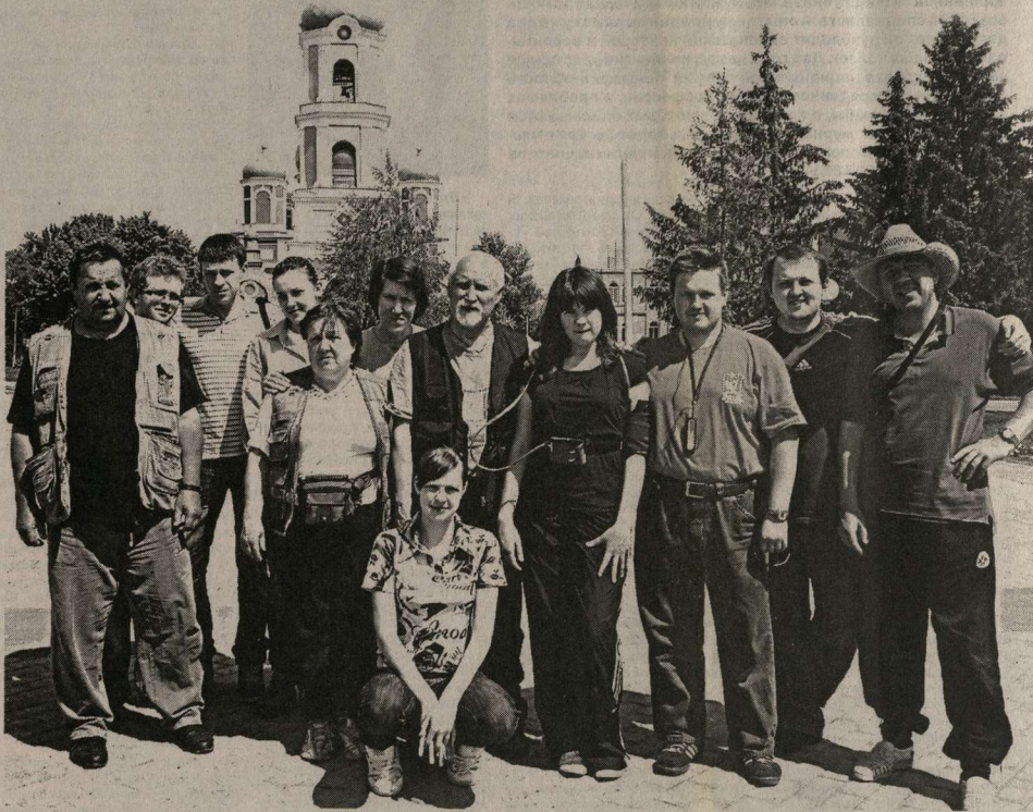
Этот снимок сделан в Новохопёрске. Через некоторое время группа учёных и исследователей-энтузиастов отправится в известную геоактивную зону поймы реки Хопёр. Это уже

не первая экспедиция по изучению загадок природы. И на этот раз учёные получили много интересной информации — об этом читайте на 5-й странице.