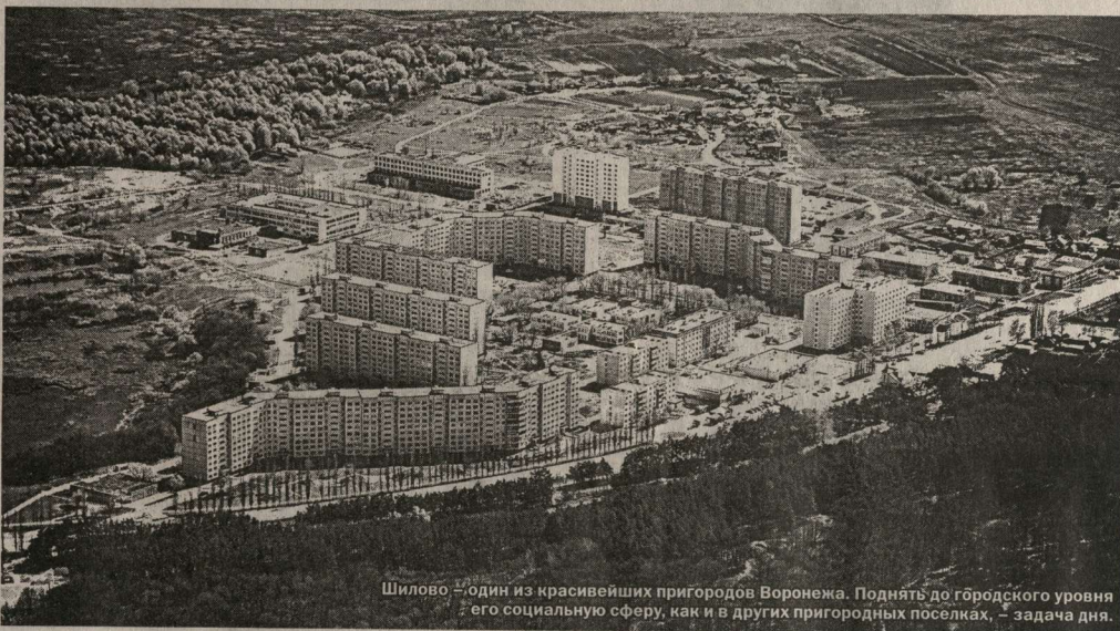
Шилово - один из красивейших пригородов Воронежа. Поднять до городского уровня его социальную сферу, как и в других пригородных поселках, - задача дня.

Разработчики Стратегии (профессорский состав ВГУ) в числе конкурентных преимуществ Воронежа называют такие: масштаб, выгода географического положения; диверсифицированная структура экономической среды; наличие (возможности) производства конкурентоспособных на национальном и мировом рынках товаров оборонного и гражданского назначения; развитая сеть образовательных, научно-исследовательских и проектных учреждений; высокий уровень образования населения; потенциал развития отраслей высоких технологий (авиакосмической, IT, систем связи, медицины и др.); деловая активность населения; насыщенность сектора малого бизнеса, банковского и других секторов рыночной инфраструктуры;