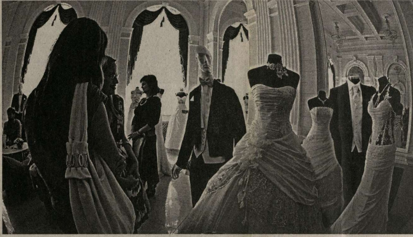
Потенциальных женихов и невест в салоне было много.