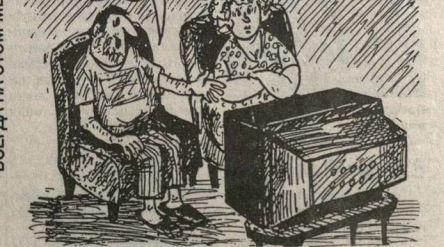
ВСЕГДА НА ЭТОМ МЕСТЕ