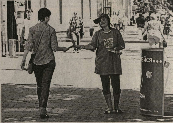
Промоутер - работа не пыльная, но и не денежная.

Вместе с тем возможностей подзаработать летом более чем предостаточно. Было бы желание. Студенты, как и школьники, попадают под категорию «работники без навыков». Отсюда и предложения по трудоустройству. В большинстве случаев студентов ждёт работа, на которую мало кто пойдёт. Например, промоутер. Ну кто ещё согласится под палящим солнцем или проливным дождем раздавать рекламные листовки нового ресторана или раскладывать в костюме гигантского телефона? За месяц такой работы можно получить две, если сильно повезёт - пять тысяч рублей. Но хочется-то всегда большего! Гораздо