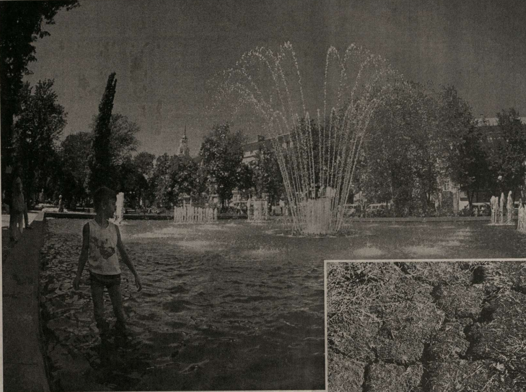
Оазис прохлады... Еле, конечно, фонтан работает.

Это беда не только нашего города. Включаем телевизор и слышим: в связи с рекордно высокими температурами главный санитарный врач России Геннадий Онищенко предложил продлить время обеденного перерыва. Полагает, что работодатели должны в жаркие дни давать возможность своим сотрудникам подольше отдохнуть. С чьей-то легкой руки этот почин Онищенко тут же получил красивое название «сиеста» (последобеденный короткий отдых, являющийся общей традицией некоторых стран с жарким климатом). Главный санитарный врач, правда, тут же от заморского понятия отстрелился. «Слово «сиеста» я никогда не произносив, для меня это ругательство, - заметил в интервью агентству РИА «Новости» глава Роспотребнадзора. - Я веде