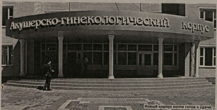
Новый корпус почти готов к сдаче.