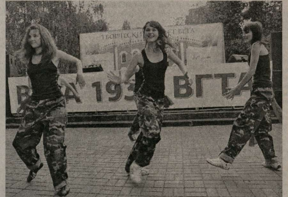
Искромётность, зажигательность – в традициях студентов ВГТА.