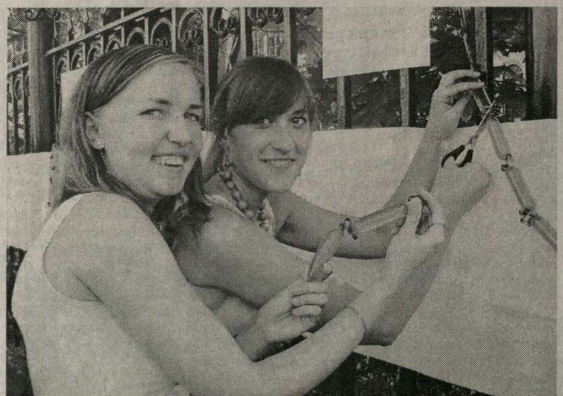
Ох, и вкусны праздничные сосиски!

– Мой папа заканчивал нашу академию по специальности «Автоматизация». Поз-