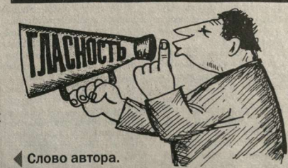
ВСЕГДА НА ЭТОМ МЕСТЕ