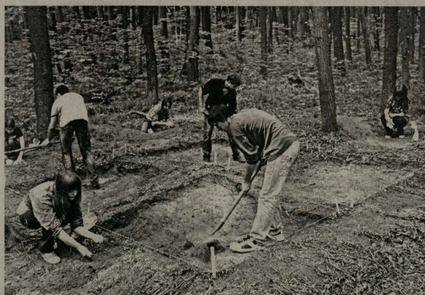
Археологи на раскопках. Древние находки на поселении Лысогорское-5.

По договору археологи закончат своё обследование 30 июля и дадут мэрии рекомендации по изменению трассы водовода. Учёные надеются, что власти всё-таки примут решение признать Воронежской нагорной дубраве статус особо охраняемой природной зоны.