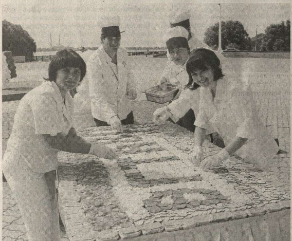
Юбилейное угощение – своими руками.

«Виват, академия!» 80 лет – прекрасный возраст зрелости и надежд.