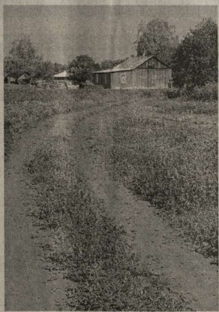
Дорога в посёлок Израильский.