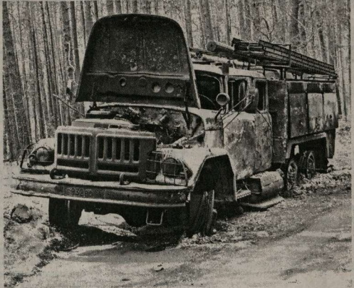
На такой пожарной технике далеко не уедешь.

Нет и той техники, с помощью которой велось лесохозяйственные работы. Спецмашины, спецтехника, спецсамолёты и вертолёты – всё в прошлом. Летает в небе два Ил-76 и один Ми-8, сбрасывает воду (на 13.30 июля – 420 т), трудятся. А где пресловутый Бе-2 Таганрогского авиазавода, доказавший свои уникальные способности по тушению пожаров в Греции и Испании? Всего 1-2 экземпляра, остальные проданы за рубеж. А ведь его присутствие, с учётом зеркала Воронежского водохранилища, сыграло бы из неоправданно разрушений и колоссальных расходов. Вот и радио сообщают об убийствах, похоронивших 29 июля: сгорело 120 домов, выгорело 1000 га леса (туда шло по меньшей мере на две удойности), 5 человек (среди них и пожарные) погибли, 100 человек ранены, 21 в больнице. Настоящая битва. Битва за жизнь, которая выигрывает чётко и прямо: пожарная техника гибнет, потому что они не в силах остановить рабуноушедшую стихию. И к тому же что они могут и без необходимой техники, и в оди-