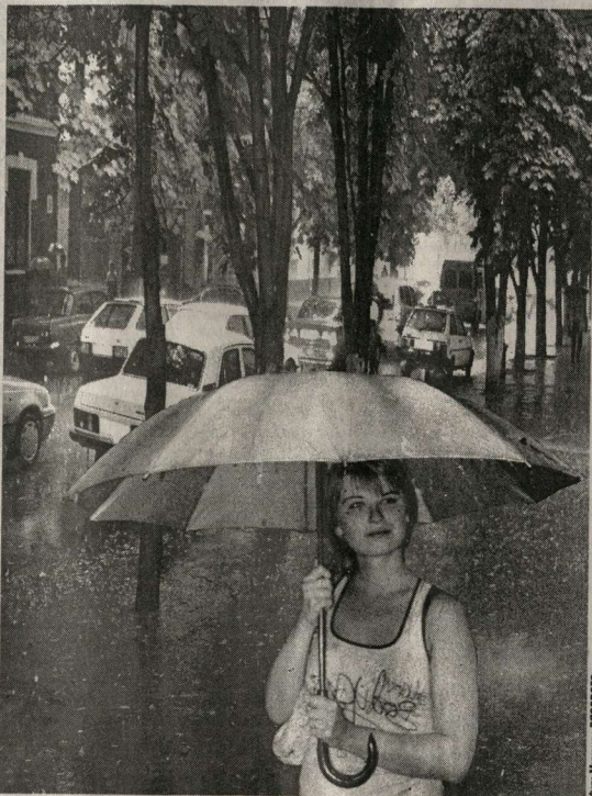
Все мы в ожидании дождя...

Слушается, стучит... Только почему-то стук этот больше похож на удары костяшек пальцев по стеклу. Так оно и есть? Кто-то стучит в окно, а кто-то думал... Виноват, приснул немного, хогя и середина дня. Не знаю уж, какого по счёту, но жаркого до умопомрачения, знойного и сухого, как порошок. Почти два месяца без дождей, в ожидании несомненно, вот и привиделся мне дождь в коротком полусне. «Наш» дождь.