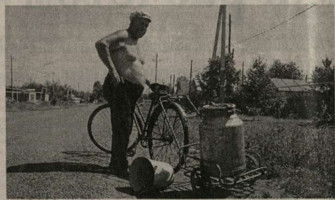
Куда ехать за водой?