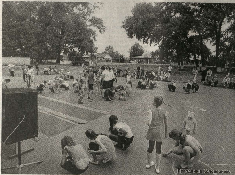
Праздник в Колодезном.

Сельская культура | Клубные учреждения Каширского района в поисках пути выживания