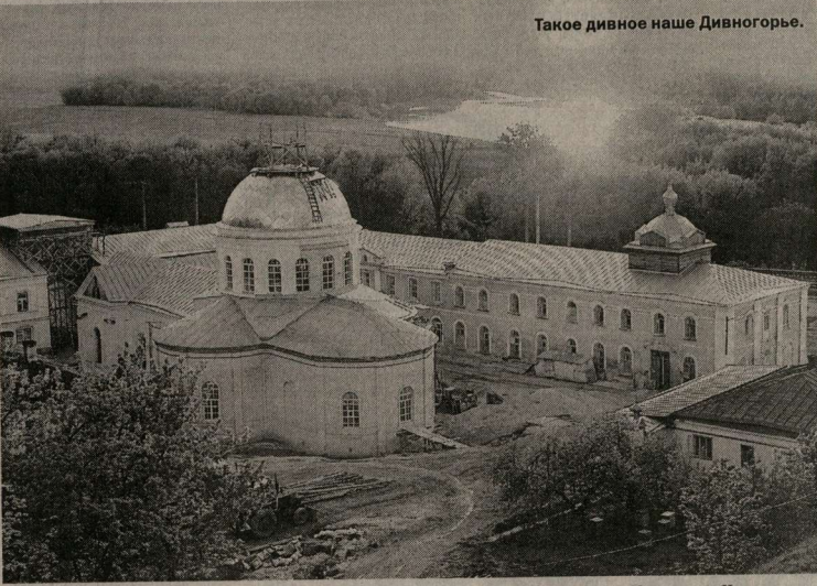
Такое дивное наше Дивногорье.

Губернатор Алексей Гордеев провёл очередное заседание президиума областного правительства, на котором рассмотрен комплекс вопросов, касающихся улучшения имиджа Воронежской области и укрепления инвестиционной привлекательности региона