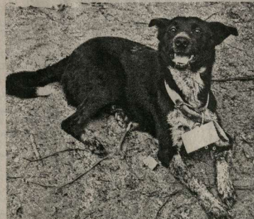
Она ждёт своего хозяина.

– Мы берём у людей их координаты и периодически встречаемся с ними, смотрим, в каких условиях находится