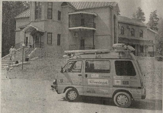
Так выглядит электромобиль.