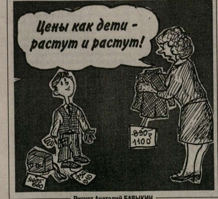
Рисует Анатолий БАВЫКИН