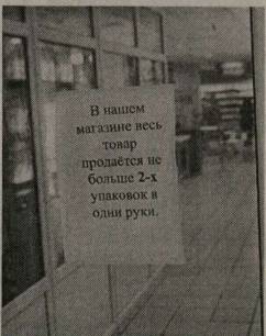
В нашем магазине вес товара продвигается не больше 2-х упаковок в один рулон.

Интересно, 60-63 рубля за 900-граммовый пакет – это предель-