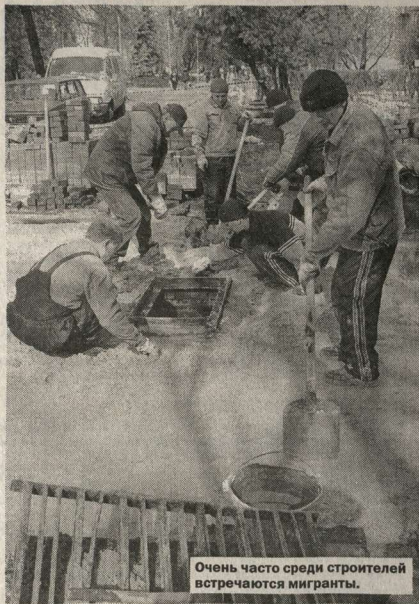
Очень часто среди строителей встречаются мигранты.