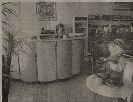
Уголок магазина в Гремячем

Большинство кооперативных предприятий районов работают стабильно, без убытков. Успешно развиваются. Реконструируются действующие магазины, предприятия общественного питания с внедрением прогрессивных форм и методов обслуживания населения. Использование возможностей рынка позволило строить далеко идущие планы по расширению количества предприятий и цехов по переработке сельхозпродукции, производству полуфабрикатов. Появилась возможность открыть в каждом районе мясные лавки и