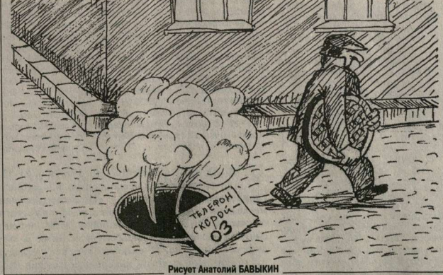
Рисует Анатолий БАВЫКИН