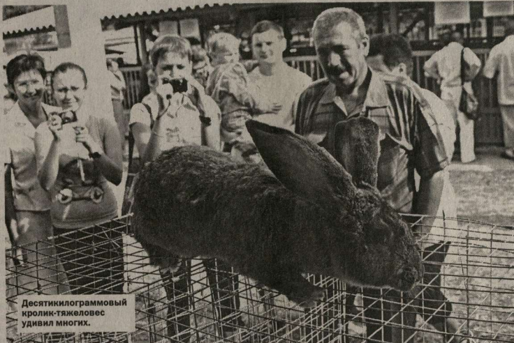
Десятки килограммовый кролик-тяжеловес удивил многих.

В Новоусманском районе вчера открылась областная выставка-продажа сельскохозяйственных животных