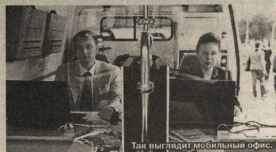
Так выглядит мобильный офис.