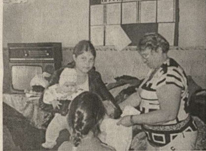
Сбор вещей продолжается.

В Центре социального обслуживания населения продолжают принимать одежду, обувь, постельные принадлежности. Собрано уже более тысячи единиц. Хватило и пострадавшим от пожаров, и малообеспеченным семьям. Сюда обращаются за одеждой и для взрослых, и для детей, особенно сейчас, когда уже наступили первые холода.