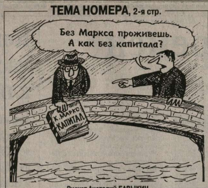
ТЕМА НОМЕРА, 2-я стр.

Алексей Гордеев также заслушал информацию о ходе строительства жилья для граждан, пострадавших от лесных пожаров, потребовав держать ситуацию под постоянным контролем.