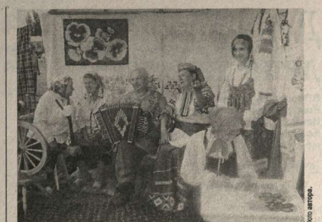
Каширское подворье, фестиваль «На родине М.Е. Пятницкого».

Напомним, что участники программы финансирования пенсий в течение года должны добровольно перечислить в фонд сумму от 2 до 12 тысяч рублей, а государство обязуется удвоить этот капитал. В принципе максимальный размер личных взносов не ограничен, но максимальный размер бюджетной сооплаты не может превышать 12 тысяч рублей. Платить можно ежемесячно или разовым платежом. Третьей стороной финансирования может выступить работодатель, который при этом получает существенные преференции от государства. Программа рассчитана на 10 лет с момента первого добровольного взноса гражданина, а вступить в нее можно до 1 октября 2013 года.