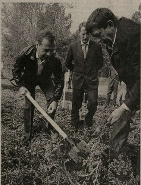
Президент Дмитрий Медведев убедился в Воронеже: картошки мало.

Упадут, как и всё урожайное солнце спалило! А то, что осталось, спекулянты на корню скупили. Вот и ломят теперь цены астрономически. Они лучше сносят её на складах, но рубля не уступят, - возмущается мужик лет шести-