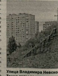
Улица Владимира Новикова. Такие горы не украшают город.