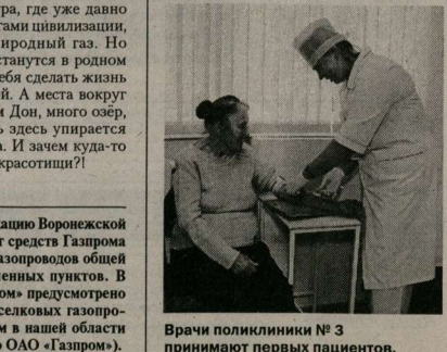
Врачи поликлиники №3 принимают первых пациентов.

На Новгородской скоро начнет действовать новый филиал стоматологической поликлиники №6. Лечебное учреждение уже полностью оснащено современным медицинским оборудованием. В филиале будут работать 4 кабинета врачей-стоматологов, которые смогут принимать до 40 пациентов за одну смену. «В нашем городе уже появилось много государственных медицинских учреждений, оборудованных по последнему слову техники. Они успешно конкурируют с частными клиниками: и квалификация врачей высокая, и оборудование современное. Даже малообеспеченные граждане смогут теперь получить качественную медицинскую помощь», — сказал мэр. Он также подчеркнул, что до конца декабря будут сданы все девять объектов здравоохранения, открытие которых запланировано на 2010 год.