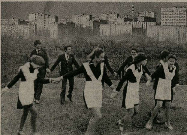
Раньше школьницы были легко узнаваемы.

Так, может, дать детям возможность одеваться по своему желанию? Глядишь, они и форму носить начнут?