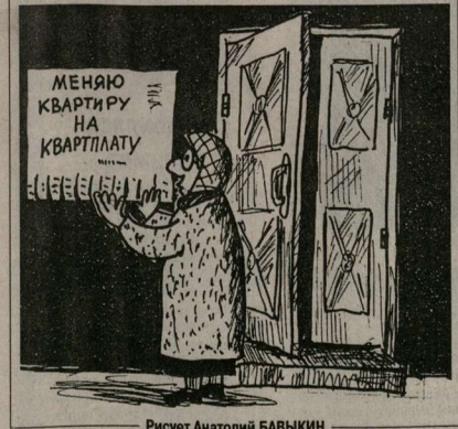
Рисует Анатолий БАВЫКИН