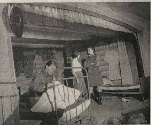
Сцена из спектакля «Это, девушки, война».

По уровню спектаклей это был лучший фестиваль за все годы его существования.