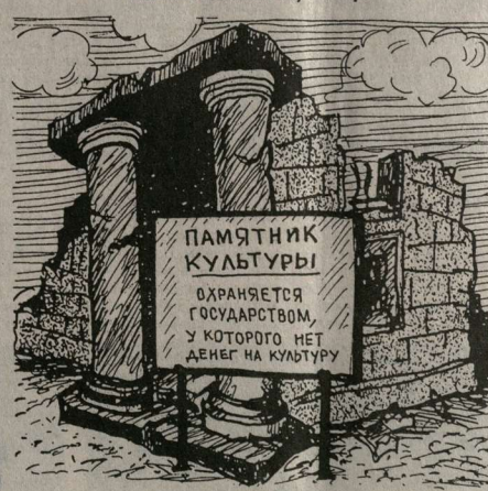
Рисует Анатолий БАВЫКИН