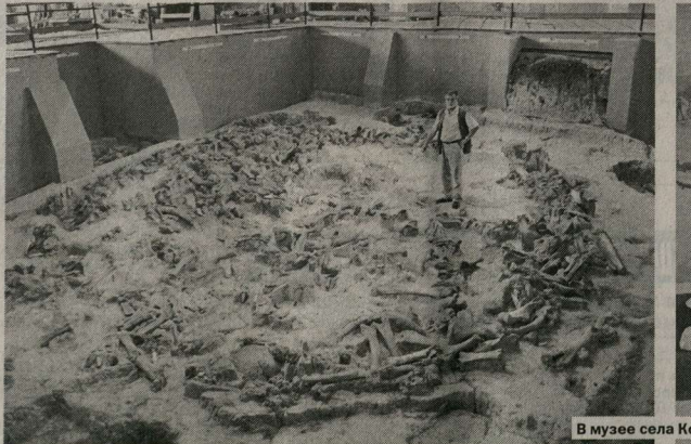
В музее села Костёнки.

Именно его носители примерно 40 тысяч лет назад, после её распада на 4 субстрата, с широт Среднего Дона расселились в горах Кавказа и дали импульс к рождению тамонных древнейших (денекавказских) диалектов. Отсюда же началось освоение территории Волго-Уральского междуречья и Южного Зауралья носителями протоуральских и протоалтайских языков. Те же из них, кто ещё на «некоторое время» (10 тысяч лет) задержался в районе Костёнок, как доказывают представленные им факты археологии и лингвистики, ушли в западном направлении, положив начало народам протонидерейской общности.