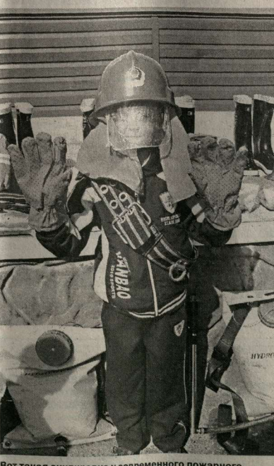
Вот такая экипировка у современного пожарного.

Что же касается самой благотворительной акции, то она продлится до конца года. Задача федерального и областного центра технической поддержки населенные пункты, которые особенно нуждаются в укреплении пожарных расчетов, где есть угроза возгорания лесного массива. Всего в сельские поселения должен поступить 71 пожарный «ЗИЛ», не считая обмундирования и прочих средств защиты и борьбы с огнем. Кроме того, есть идея построить новые пожарные депо в пригороде Воронежа – в Масловке, Шуберском и Подгорном.