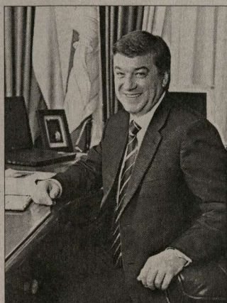
Сергей Колиух, глава администрации Воронежа

— Мы уже не раз говорили о том, что все вопросы совершенствования городской инфраструктуры, благоустройства, развития социальной сферы администрация стремится решать комплексно. Возьмем, к примеру, благоустройство. Это не только ремонт и реконструкция центральных улиц Воронежа, зеленых зон, вывоз мусора, но и привлечение в порядок дворовых территорий, строительство детских и спортивных площадок, восстановление и монтаж новых сетей уличного освещения, ремонт домов и многое другое. И в ближайшее время мы планируем расширение масштабов этой работы. Так, кроме реконструкции набережной Массалитина, которая разгрузит центр города, начнутся работы на улицах Антонова-Овсеенко, Ломоносова и Шишкова, что позволит существенно