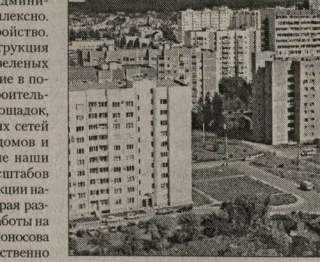
Вид на жилую застройку в Воронеже

— В завершение беседы хотелось бы вновь вернуться к предстоящему Дню рождения Воронежа. Давайте назовем тех, кто помог подарить горожанам праздник.