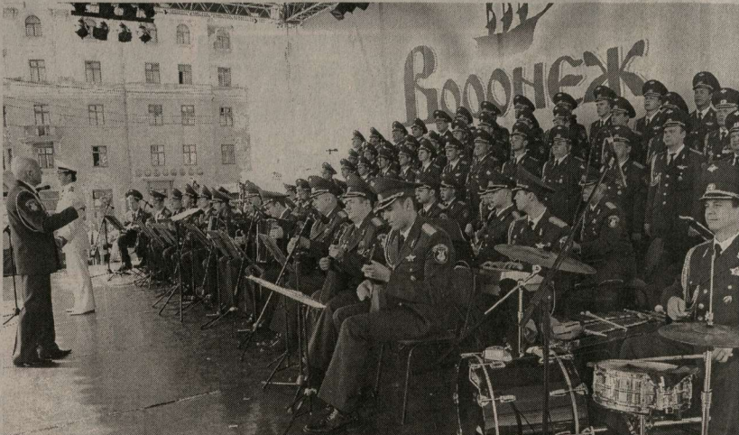
Выступает знаменитый ансамбль имени А.В. Александрова

На проспекте Революции жители развлекались самыми разными уличными коллективами