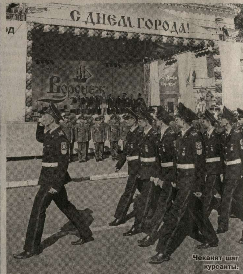
Чеканят шаг курсанты.