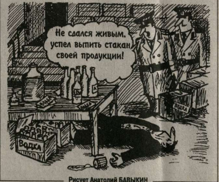
Рисует Анатолий БАВЫКИН