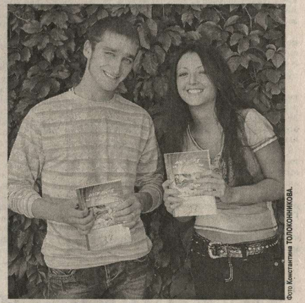
Родик Прилепин и Нина Туркина.