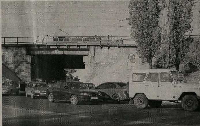
Та самая «вышка».

Придет ли она в нынешнем году к заждавшимся её лискинцам?