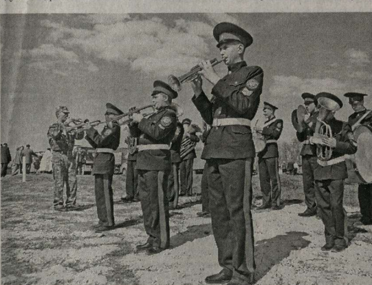
Духовой оркестр казачьего кадетского корпуса.

Но уже после войны, в пятьдесят пятом, его разрушили воинственные атлеты. А трид-