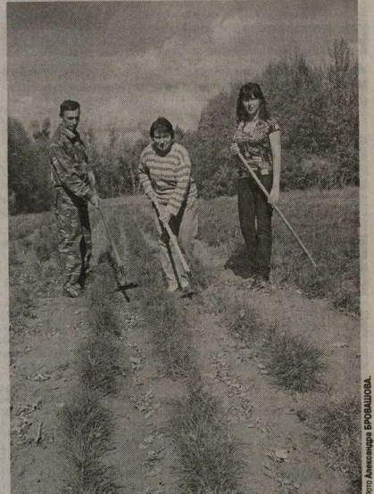
Здесь, в питомнике, начинается будущий лес.

Вся проводимая работа со школьными лесничествами, от делами образования, сельскими администрациями вошла в программы совместных действий, которые подписали руководи-