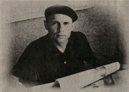
Алексей Прасолов. Над газетной полосой. Россошь. 1967 год.

Поэт, сказавший и - времени в себе. «Я славянин: мое счастье, что я не северный, что во мне, как в месте, где рожден, скрестилась кровь Южной России, Малороссии... С детства - устный (от окружающих) Шевченко, школьные - Пушкин, Лермонтов (ставшие сразу несколькими для меня), поэзия, по мере моего углубления - рембрантовский мрак от Лермонтова (даже от глаз его на портрете и от букв его поэзии), идущий к нежному, но такому же (только больше) мрачному Блоку, к ночной душе - Тютчеву и дальше...»