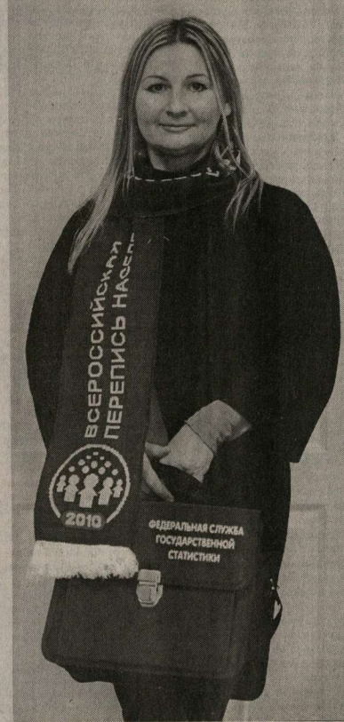
Переписчики готовы к работе.

Что касается включения Воронежа в число городов-миллионников, то такая вероятность не исключена. Это откроет для него новые возможности, связанные, в первую очередь, с предоставлением федеральных дотаций, а значит, – с улучшением качества жизни горожан.