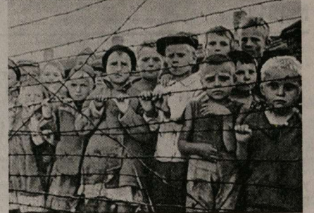
— Что планируете делать?

— Намегили издать, к примеру, большую книгу воспоминаний. Планируем вести большую разъяснительную работу в образовательных учреждениях. Нынешние школьники не знают, что такое Холокост, Бухенвальд, Освенцим. Это очень тревожная ситуация. В каждой школе необходимо создать уголок «Детство, опалённое войной». Организовать подписку на газету «Судьба» — это единственное в мире периодическое издание, выпускаемое бывшими узниками нацистских концлагерей. В Воронеже и других населённых пунктах надо установить мемориальные доски, посвящённые памяти узников фашизма. Такая работа давно уже ведётся во многих российских регионах, в частности, Владимире, Белгороде, Санкт-Петербурге. Наша область, к сожалению, безнадежно отстала.