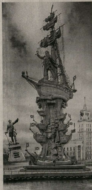
Сошлот ли в Воронеж Петра большого?

Сразу после социологического почина «Квасовцы» создали инициативную группу «Нам нужен Петр I», и та принялась собирать подписи горожан с просьбой к московскому правительству, чтоб оно подарило Воронежу этот памятник в честь 300-летия Российского флота. О сборе подписей Квасов широко оповестил федеральные СМИ, часть из которых проинформировала результаты сомнительного опроса и поверила, что жители города, опрошенные местными СМИ (названия не уточняются), го-