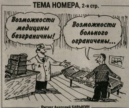
ТЕМА НОМЕРА, 2-я стр.