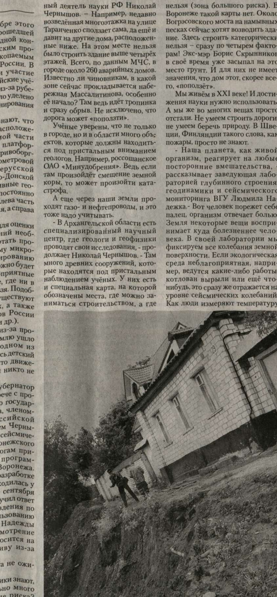
Подобных домов над пропастью в Воронеже хватает.

О геологических проблемах, которые не учитываются при строительстве