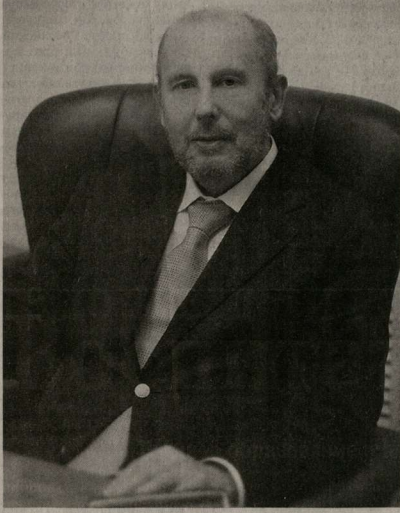
способствует формированию научного студенческого общества.