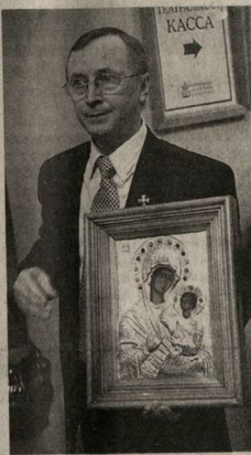
Президент международного кинофорума «Золотой витязь» Николай Бурляев.

Президент международного кинофорума «Золотой витязь», напомнил: даже в самые трудные в истории взаимоотношений двух стран последние годы святые патриархи двух православных церквей – Кирилл и Илья II – не