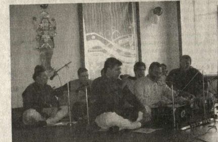
Выступает сводный ансамбль индийской музыки и песни из Москвы и Коломны.