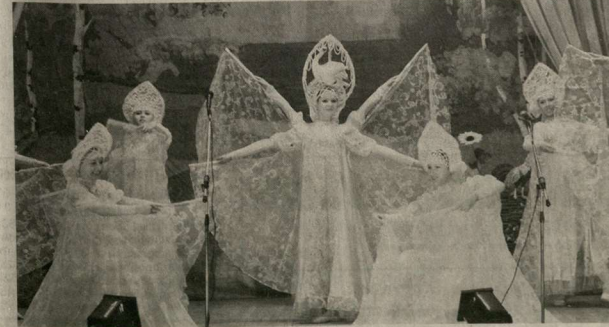
На сцене - лискинские артисты.