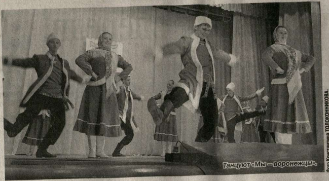
Танцуют «Мы — воронежцы».