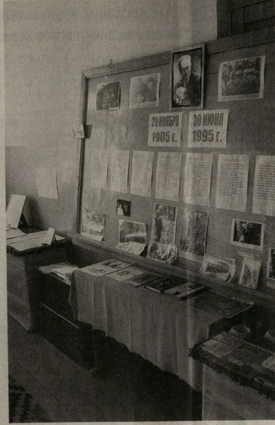
Школьный музей Г.Н. Тропольского в Хомутовке.

И вот 31 июля 1931 года это дело, под номером 111, было рассмотрено на заседании так называемой «тройки» ОГПУ.