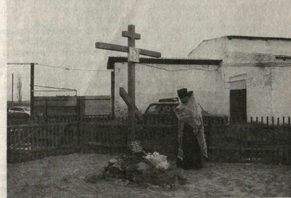
Освящение поклонного креста в Мазурке.

«Время собирать камни», разбросанные воинствующим атеизмом советских времён, наступило и для Мазурского поселения. Здесь установлен и освящён поклонный крест на том месте, где когда-то возвышался храм в честь иконы Казанской Божьей Матери. Это уже второй поклонный крест, который был установлен в поселении. На освящении креста, кроме многочисленных сельчан, присутствовали главы сельских поселений и казаки второго Хоёрского казачьего округа во главе со своим атаманом В.Телегиным.