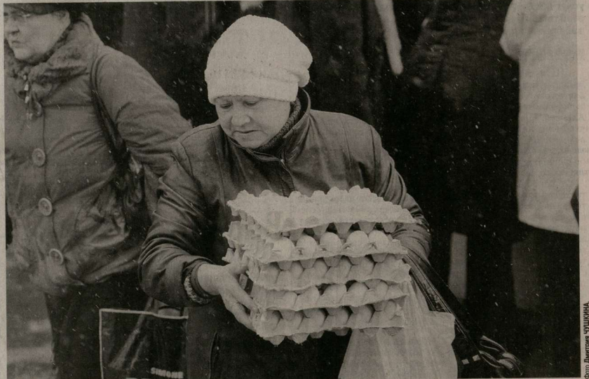
В минувшую субботу в Воронеже сразу в нескольких местах прошли сельскохозяйственные ярмарки. Продуктами питания с горожанами поделились многие районы области. Первая осенне-зимняя ярмарка началась несколько скромной, поэтому принято решение проводить их каждый выходной, а самая крупная распродажа продовольственных товаров состоится в канун Нового года.

Одновременно говорилось о том, что необходимо и дальше совершенствовать работу с кадрами, шире внедрять научные достижения и передовой опыт, активнее привлекать творческую молодежь. Рекомендовано также полнее использовать имеющийся опыт работы с людьми, укреплять связь власти с народом, теснее взаимодействовать с партиями и общественными организациями.