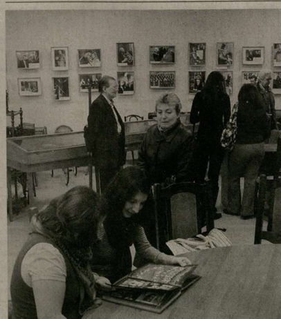
Воронежцы осматривают новую экспозицию.

Информация подготовлена пресс-службой УФСП по Воронежской области.