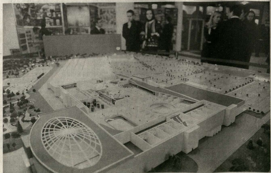
Реализация новых проектов – это ключевая составляющая улучшения социально-экономической ситуации.

– Я убежден, что мы должны развивать и профессиональный, и любительский футбол, поскольку у нас очень много поклонников этого замечательного спорта. На товарищеском матче между сборными России