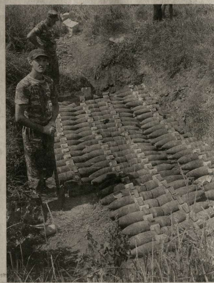
Уничтожение снарядов времен Великой Отечественной войны в Хохольском районе у села Кочетовка.

По аналогии областной ПСС в крупных районных мегаполисах – Лисках, Павловске, Борисоглебске – созданы муниципальные службы. А среди совсем «свежих» подразделе-