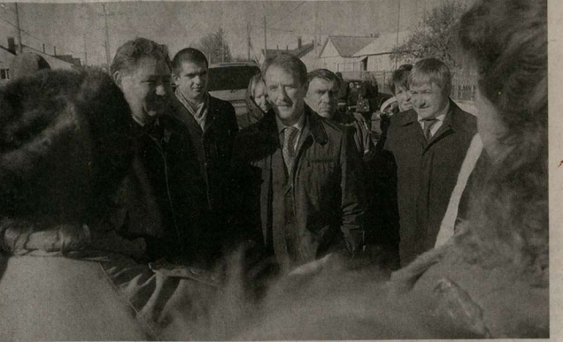
Встречи с людьми – постоянная задача губернатора Алексея Гордеева в поездках по области.

По поводу другой затронутой вами темы – сохранения исторического наследия – могу сказать, что и эта проблема не выпала из поля зрения правительства. Мы создали Обще-