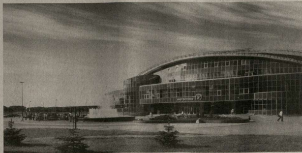
Футбольный манеж в центре Минска.

А вечером в центре Минска, в реке Свислочь, увидел стаю диких уток. Как ни в чем не бывало они плавали, ныряли и не обращали никакого внимания на проходящих мимо горожан. Минск хорошеет с каждым годом. Появляются новые проспекты, скверы, «народные памятники», которые пользуются огромной попу-