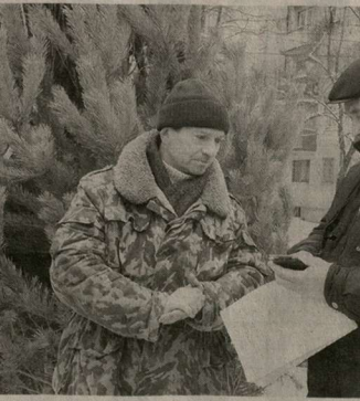
Откуда пушистые красавицы?

Как сообщил ведущий консультант отдела государственного лесного контроля и надзора, охраны лесов Управления лесного хозяй-