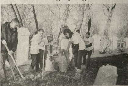
Уборка в одном из городских парков.

Семилуцкое молодежное общественное движение «Рассвет» началось с простого, но полезного дела. В середине прошлого лета компания друзей – студентов и школьников – решила навести порядок в одном из парков.