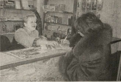
В Новоогольчанском отделении связи.

Долгие годы Новоогольчанское сельское отделение почтовой связи располагалось в различных помещениях. То в сельском клубе, то в частном доме. В начале декабря почтовое отделение переехало в новое здание. Помещение почтовикам выделила местная администрация, а средства на ремонт — почтамт. Теперь здесь созданы достойные условия труда: есть клиентский зал, комната для почтальонов, подсобное помещение.