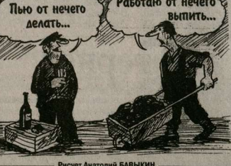
Рисует Анатолий БАВЫКИН