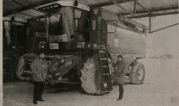
Специалисты сервисного центра осматривают КЗС-1218.

Комфорт и уют современной кабины КЗС-1218 с