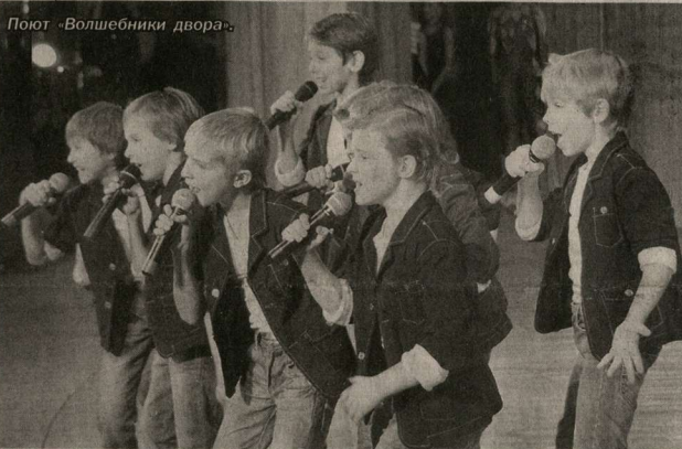
Поют «Волшебники двора».