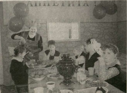
В школьной столовой.

Под столовую выделили два класса, сделали основательный ремонт, подвели все коммуникации, установили оборудование. И вот столовая заработала. Ей очень рады дети и педагоги.