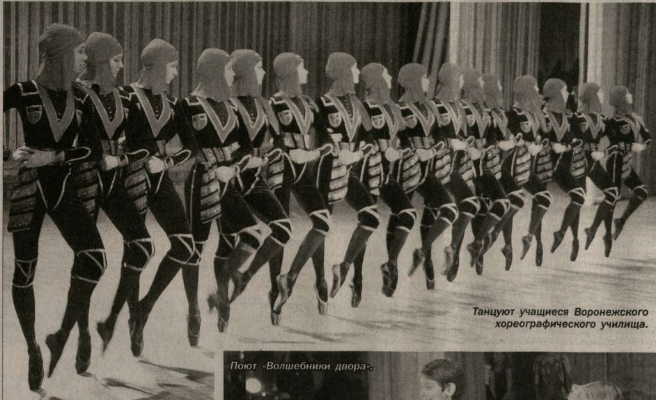
Танцуют учащиеся Воронежского хореографического училища.

С места события | В Воронеже прошёл гала-концерт, в программе которого выступили лучшие самодеятельные и профессиональные коллективы