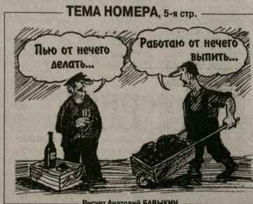
ТЕМА НОМЕРА, 5-я стр.

Проведение этой конференции имеет особый смысл - поскольку у нашего достаточно стабильного в отношении