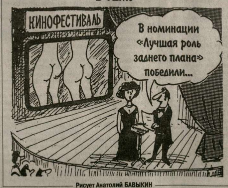
Рисует Анатолий БАВЫКИН