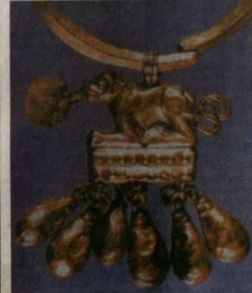
Одна из золотых подвесок с пантерой, найденная в районе села Колбино.