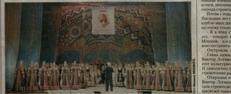
Выступает Воронежский народный хор.